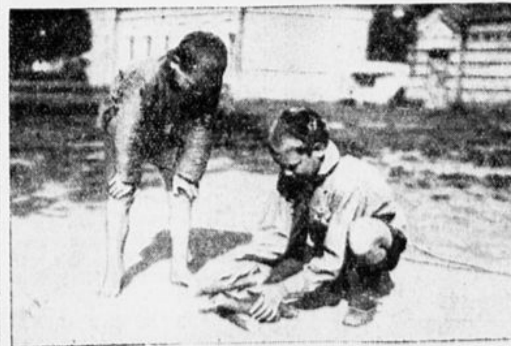
СКОРО ЗАКИПИТ БОЯ.

От редакции. Считаю этот вопрос очень важным, предлагаем всем ребятам присылать опыт работы и практические предложения.