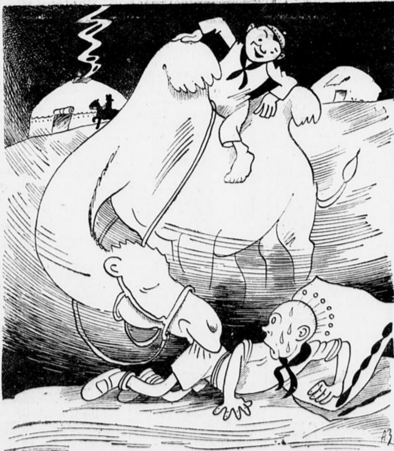
ПОСЛАНЕЦ ИЗ КАЗАКСТАНА: — «ВСТАНЬ, ПРОСНИСЬ, НА МЕНЯ ПОСМОТРИ»...