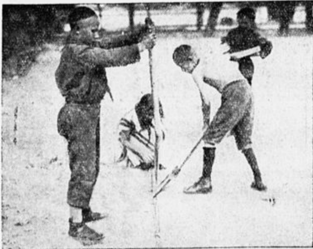
УСТРОЙСТВО ПЛОЩАДКИ—ИНТЕРЕСНАЯ РАБОТА.

Цель экскурсии: отдых на свежем воздухе, купанье в Москва-реке на хорошем пляже.