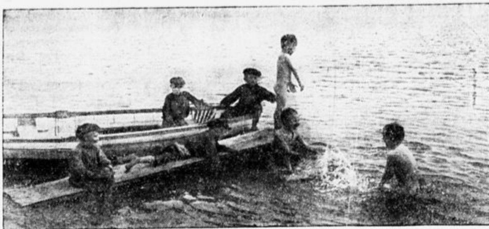
САМОЕ ПРИЯТНОЕ ЗАНЯТИЕ В ЖАРКИЕ ДНИ.