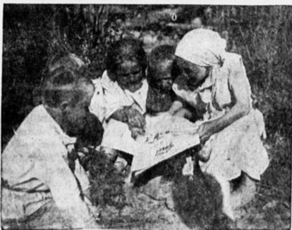
В СВОБОДНУЮ МИНУТУ.