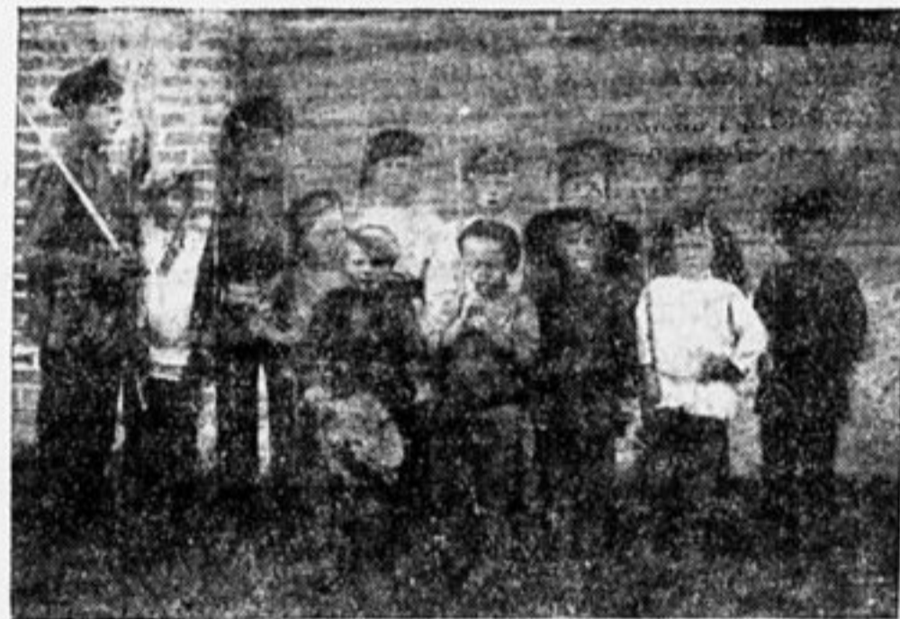
ПЕРЕД СРАЖЕНИЕМ КРАСНЫХ С БЕЛЫМИ.