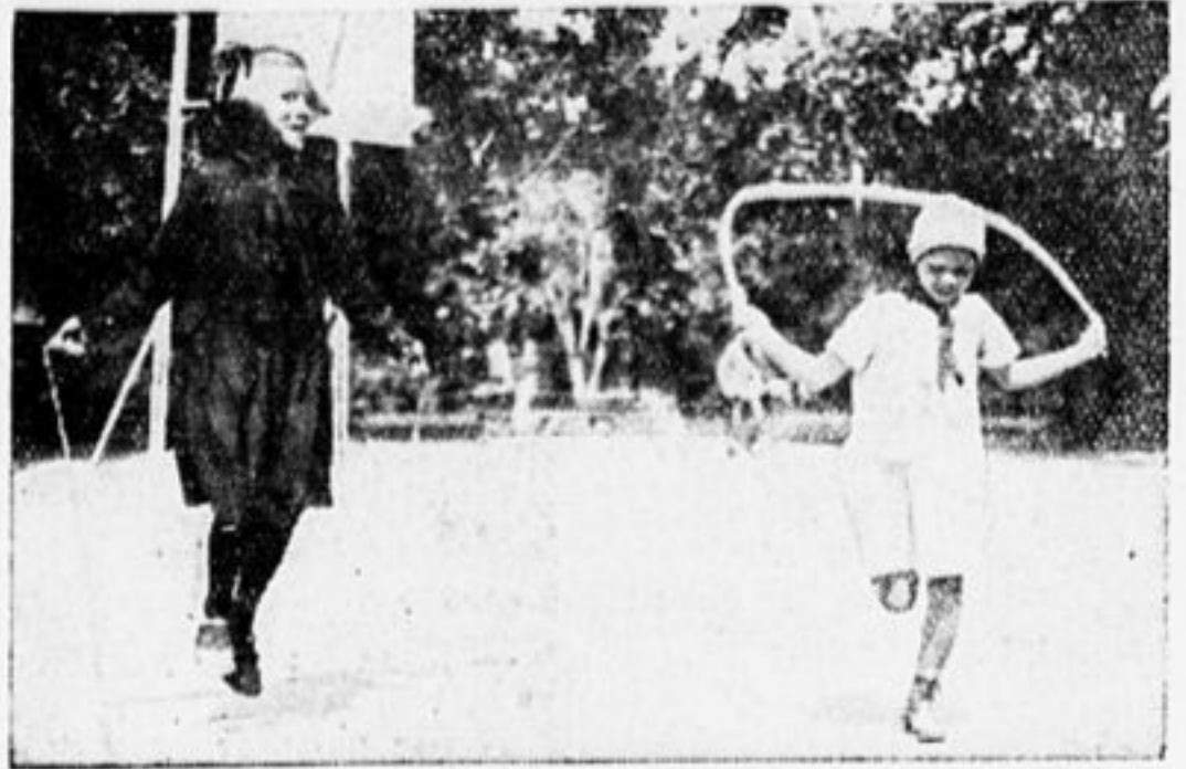
УПРАЖНЕНИЕ ДЛЯ БЕГА.

Белые: Кр. b1; Ф h3; Л h6; С d6; пешки: e7 и g6.