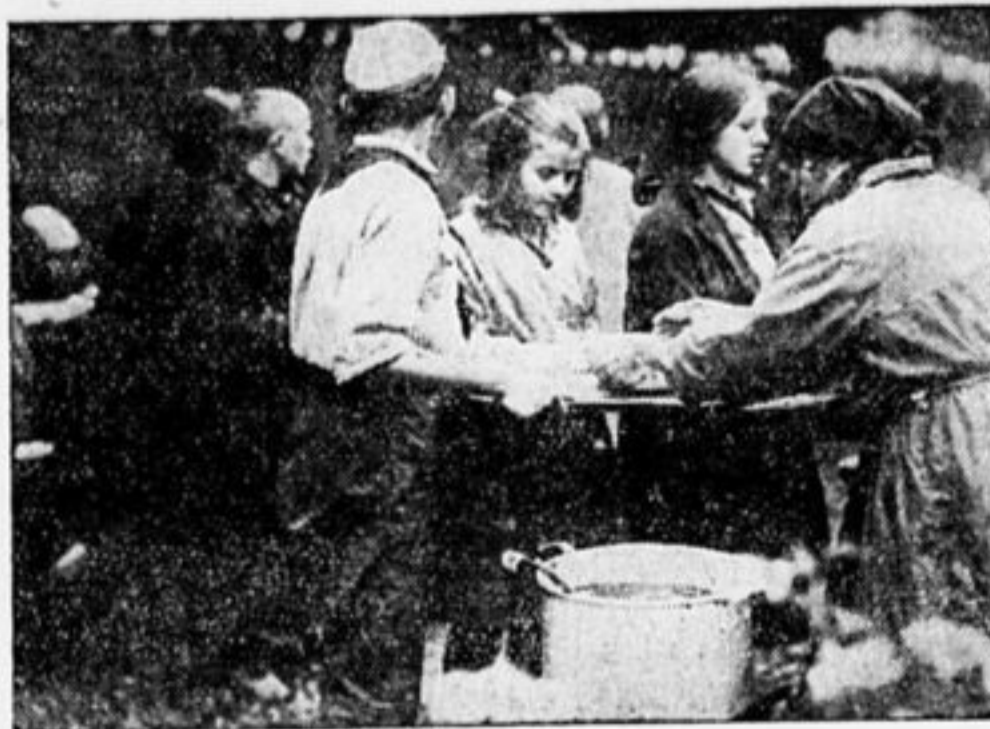
ЧАС ЗАВТРАКА НА ДЕТПЛОЩАДКЕ.