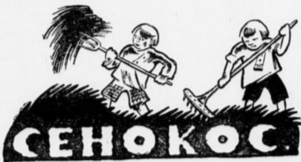
(Рассказ пионера, Кудинова, П.)

Лишь только румяное солнце покажет свой веселый лик из-за зубчатых верхушек леса, а люди уже на ногах.